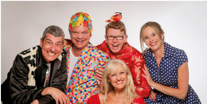
Pepper&Salt mit „Äbbes von Ällem“

Melodisch, schwäbisch und urwitzig – die Bad Uracher KulturMomente 2026 versprechen wieder ein buntes Jahresprogramm mit Konzerten, Kabarett und Theater. Und auch für die jüngsten Kulturfans ist was dabei.