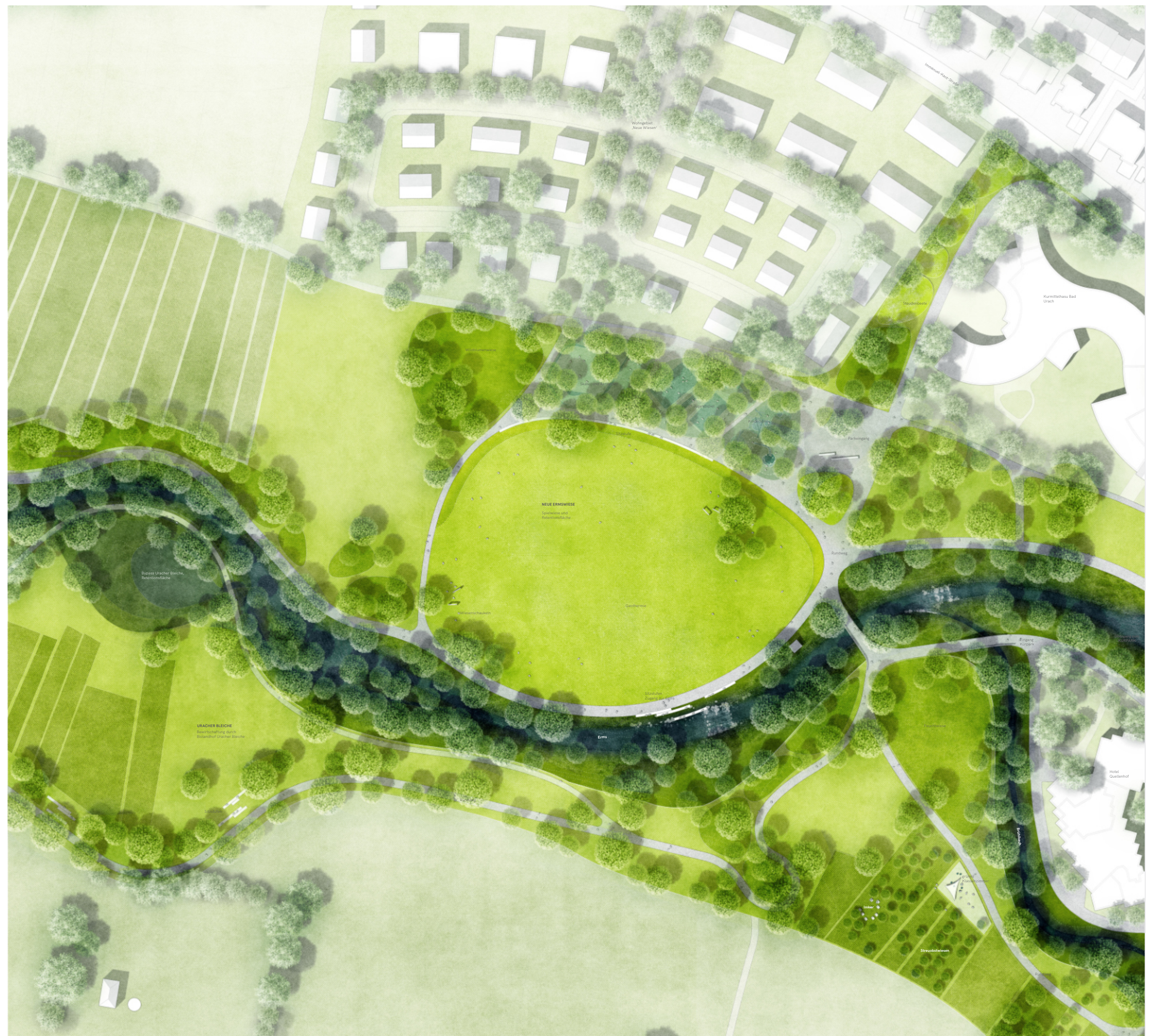
Vertiefungsbereich Ermwiesen 1:500