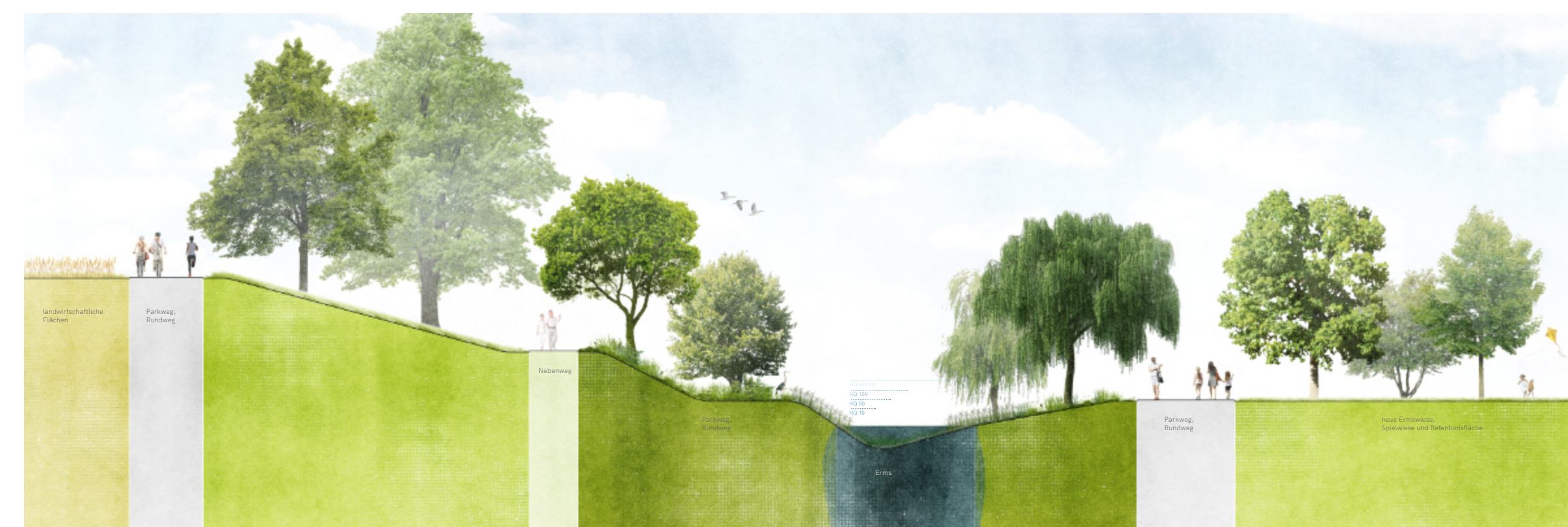
Schnitt Ermufer 1:100