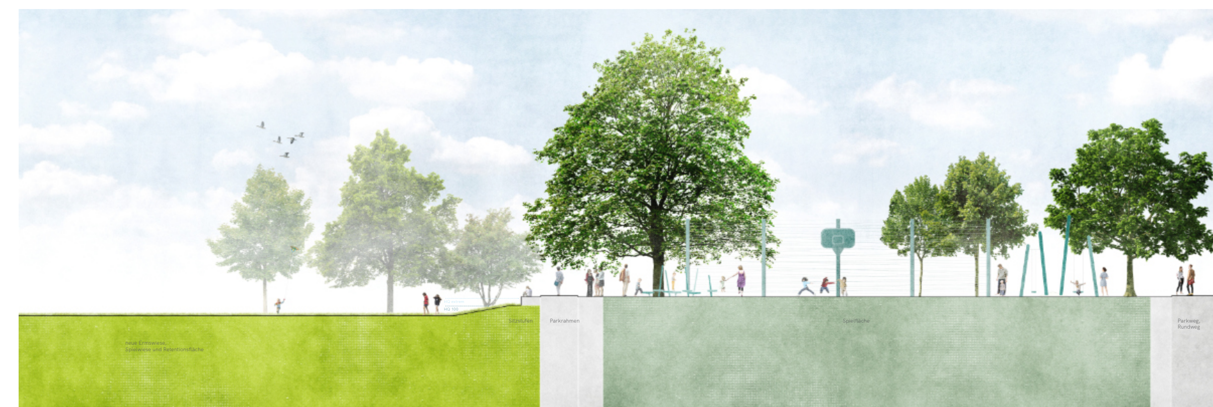
Schnitt Ermwiesen und Aktivband 1:100