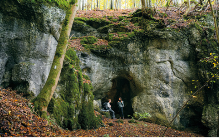
Wanderregion Bad Urach

Nachdem unsere Wanderwege in der kalten Jahreszeit immer in die Winterpause geschickt werden, freuen wir uns nun darauf, dass ab April das komplette 150 km lange Wegenetz wieder entdeckt werden darf.