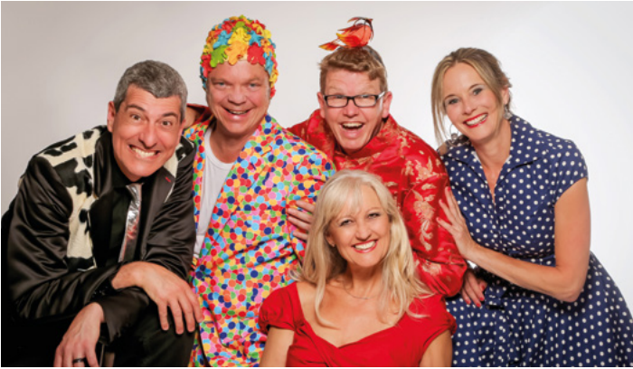
Pepper & Salt - „Äbbes von Ällem“

Wenn Bad Urach zur Bühne wird, sind besondere Abende garantiert: Unter dem Titel KulturMomente lädt die Kurverwaltung zu einer Veranstaltungsreihe ein, die Herz, Humor und Kulturgenuss auf einzigartige Weise verbindet. Ob Musik, Kabarett oder feinsinnige Satire - hier treffen große Bühnenkunst und persönliche Atmosphäre aufeinander. Freuen Sie sich auf unvergessliche Stunden, die zum Lachen, Staunen und Genießen einladen.